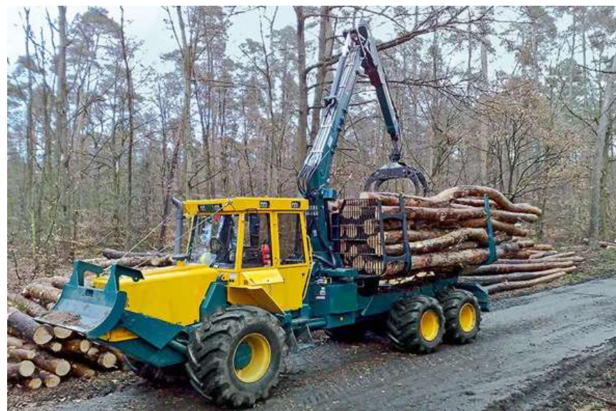
Illustration, à titre d'information, du type de tracteur forestier souhaité